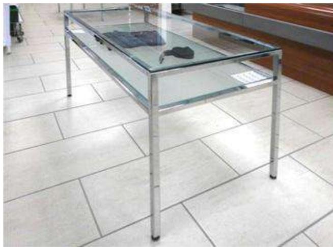
BANCO VETRO TEMPERATO DA 120 con TELAIO SALDATO

Struttura in ferro Cromata completa di piano superiore in vetro temperato e piano inferiore in vetro satinato montato su piedini telescopici. DIMENSIONI: 120 X 60 X 82 H