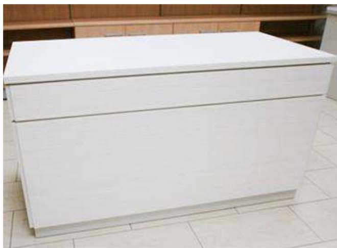
BANCO VENDITA mod. "tecno BV" DA 150 colore bianco

Banco vendita realizzato con piano di lavoro in Laminato da cm 3 rivestimento in nobilitato, n°1 cassetto montato su struttura in ferro e nobilitato. Con n°2 piani interni regolabili in altezza, colore bianco.