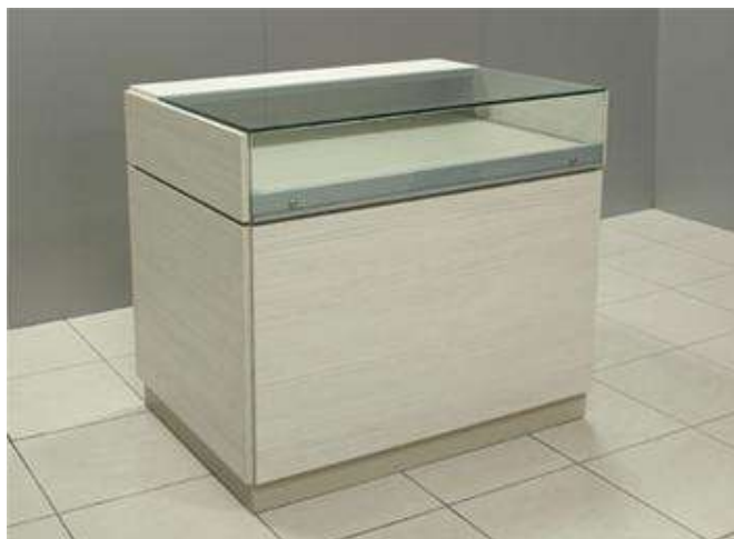
BANCO VENDITA mod. "tecno BV" DA 100 con MOSTRA

Banco vendita per negozi realizzato in legno, composto da struttura in nobilitato, piano Top in vetro temprato, cassettone con serratura su binari scorrevoli, piani interni in legno regolabili in altezza. Banco regolabile in altezza mediante piedini interni. Disponibile in vari colori di legno per adattarsi ad ogni tipologia di arredamento negozio. DIMENSIONI: 100 X 70 X 90 H