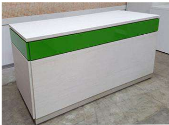
BANCO VENDITA mod. "tecno BV" DA 150 con finiture laccate verdi

Banco vendita realizzato con piano di lavoro in Laminato da cm 3 rivestimento in nobilitato, n°1 cassetto montato su struttura in ferro e nobilitato. Con n° 2 piani interni regolabili in altezza, colore bianco con finiture Laccate verdi.