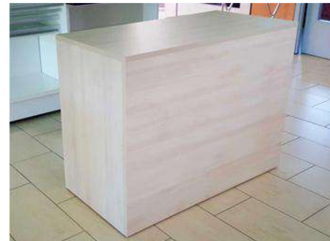
BANCO CASSA E VENDITA DA 120 colore ROVERE CREMA

Banco cassa e vendita per negozi realizzato con struttura in legno, completo di n° 1 piano interno e piedini base regolabili in altezza. DIMENSIONI: 120 X 60 X 90 H