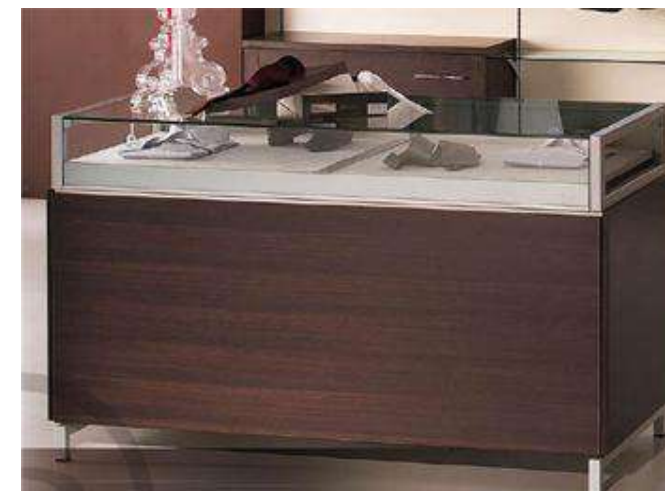
BANCO VENDITA mod. "ISOLA" DA 150 con MOSTRA

Banco vendita, mod. Isola, in legno, struttura in nobilitato, su basamento in ferro verniciata a polveri, piano Top in vetro temprato, teca in vetro con telaio in ferro verniciato a polveri con n. 2 cassettoni scorrevoli su binari in ferro con interno con rivestimento in velluto, piani interni in legno.