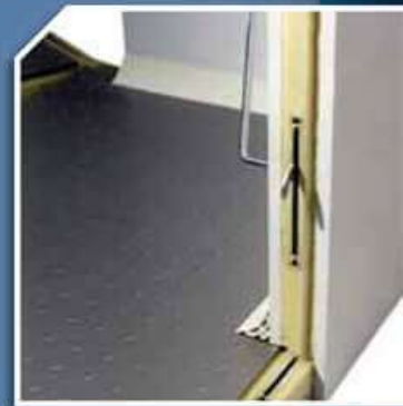
Celle senza pavimento

Pavimento + pannello: montaggio semplice e veloce tramite fissaggio con aggancio eccentrico.